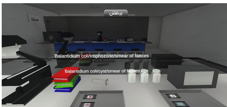
شکل 1. اطلاعات و ویژگی‌های مربوط به لام تشخیصی انگل در نمای نرم‌افزار پس از رسیدن به کنار میز و لام مربوطه به صورت خودکار به نمایش درمی‌آید Figure 1. Information and features of the parasite diagnostic slide in the software view after reaching the side of the table and the corresponding slide will be automatically displayed

جزئیات بیشتر، مطابق نیازها در آن ایجاد خواهد شد. در واسط کاربری، در ابتدا، گزینه‌های شروع، تنظیمات، درباره ما و خروج تعبیه شده است. در منوی «تنظیمات»، دو گونه تنظیم در نظر گرفته شده است. تنظیم اول مربوط به کیفیت گرافیک نرم‌افزار است که می‌تواند از خیلی کم تا خیلی زیاد متغیر باشد. تنظیم دیگر مربوط به حساسیت کنترل‌کننده‌های بازی است که مربوط به حرکت‌های 360^\circ و نیز حرکت چهار جهته در فضای نرم‌افزار است. منوی «درباره ما» توضیحاتی مختصر درباره تیم مشارکت‌کننده در این پژوهش ارائه داده است و گزینه خروج نیز برای خارج شدن از فضای نرم‌افزار استفاده می‌شود. اصلی‌ترین منوی نرم‌افزار منوی شروع است که کاربر را به فضای آزمایشگاه مجازی هدایت می‌نماید. در واقع در این نرم